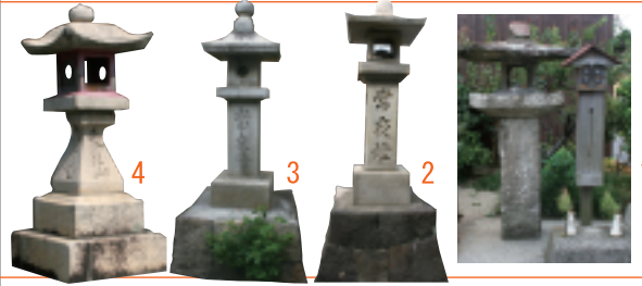
今も残る、金毘羅灯籠

有明浜の白砂に描かれた「寛永通宝」の銭形は、東西122m、 南北90m、周囲345mもある巨大な砂絵で、琴弾山頂から 望むとききれいな円形に見える。一般には寛永10年(1633年)、 藩主生駒高俊公を歓迎するため、一夜にして作られたと 伝えられる。この銭形を見れば、健康で長生きし、お金に 不自由しないと言われ、多くの人がこの地を訪れている。