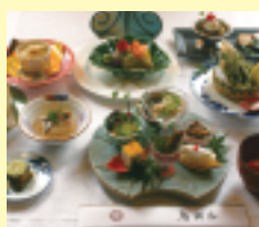
いりこ料理も食べられる(要予約)

☎(0875)23-1111 ㊟7:00~22:30 休不定期 P 60台 HP http://kotohiki.com