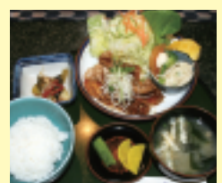
人気のタイムランチはポリウム満点！

☎(0875)25-7976 ㊟8:00~19:00 休月(祝日の場合8:00~12:00まで営業) P あり