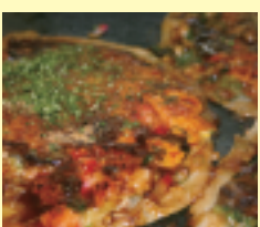
ご当地グルメ「にくてん」が食べられる！

☎(0875)25-3215 ㊟7:00~19:00(にくてんは11:30~18:00) 休日曜日 P 4,5台