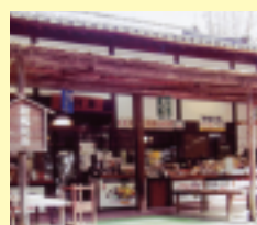
お通路さんのお休み処！

☎(0875)25-6022 ㊟9:00~16:00 休年末(数日) P 15台