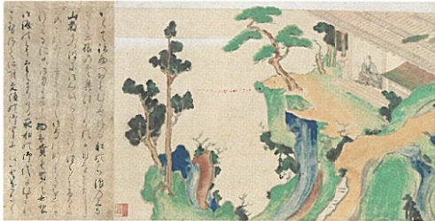
讃岐を訪れた菅原道真や西行、古人の姿 8