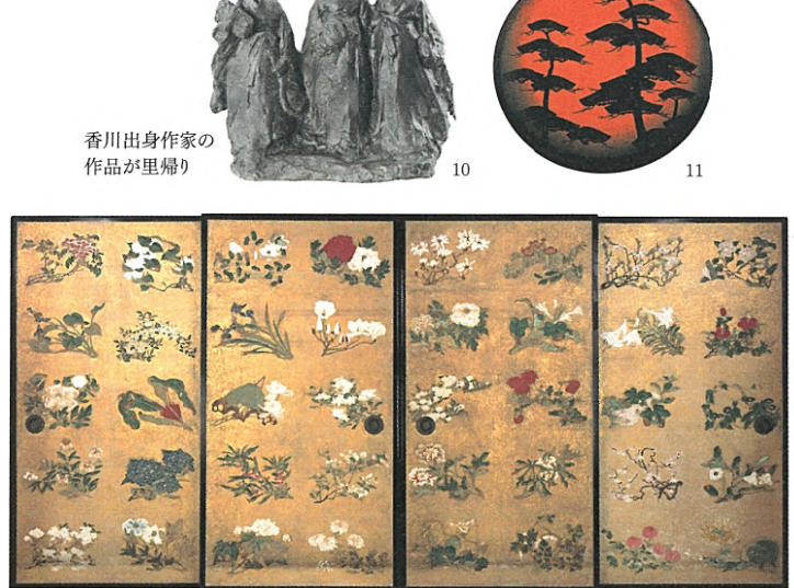
香川出身作家の作品が里帰り 10