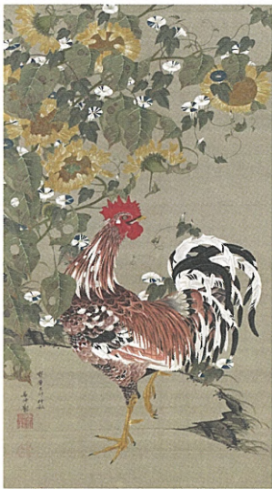
生命の瞬間をとらえる、若冲の真骨頂 9