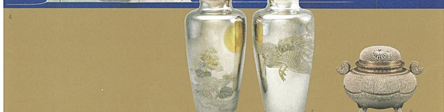
1.【国宝】伊藤若冲 動植線絵 向日葵鶏図(部分) 2. 柏葉箱形ボンポニエール 3. 丸形終に扇文ボンポニエール 4. 竹内栖鳳 大正度 主基地方風俗歌屏風(右隻 部分) 5. 海野勝取 丹鳳朝陽図花瓶 6. 沈寿官(13代) 薩摩焼 色絵菊桐透彫香爐 *全て 皇居三の丸尚蔵館収蔵