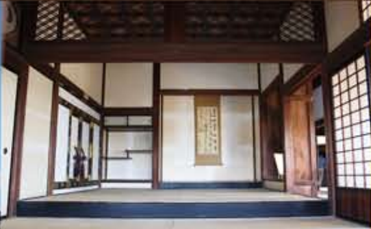
本丸御殿上段ノ間