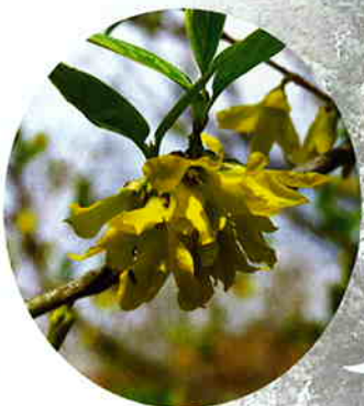
ショウドシマレンギョウ