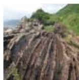
3 砂岩と泥岩が重なる地層が見える行当岬