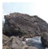
4 巨大な柱状溶岩が横たわる日沖海岸