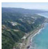
1 海成段丘でできた西山台地