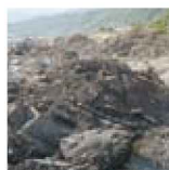
2 乱れた地層が露出する黒耳海岸