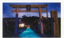
다자이후 덴만구 신사에서 신령을 나누어 모신 덴만구 신사. 세익스피어의 명인이 직접 제비뽑기도 추천. 덴만구로 이어지는 '빛의 길'은 미래로 이어지는 희망의 길. 소원을 빌며 걸어 봅시다.