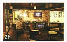
2층은 편히 쉬 수 있는 공간의 북 카페. 창문에서의 조망은 최고입니다!