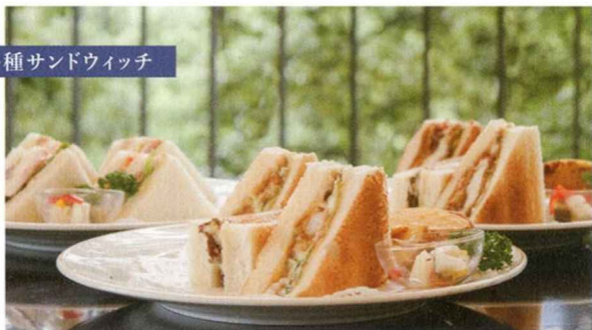
各種サンドウィッチ