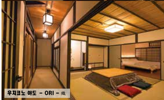
우치코노 아토 - ORI - 織