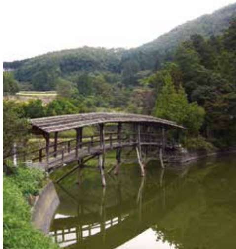
⑯ 유게 신사 타이코 다리