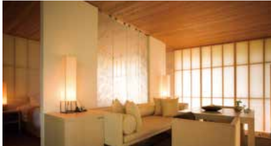
오베리류 우치코 オーベルジュ内子