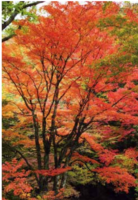
Beginning of November

마을의 동쪽 오다미야마산은 자연이 남아 있는 귀중한 산이다. 초여름의 신록, 가을 단풍 등 일본의 사계를 강하게 느낄 수 있는 최고의 경승지이다.