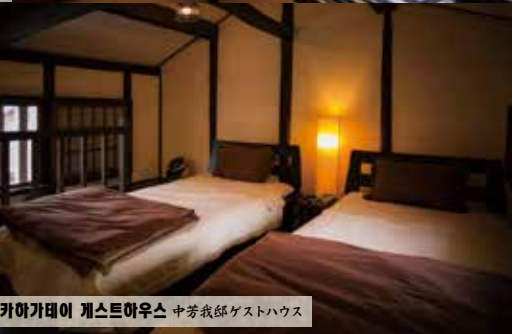
나카가타에 게스트하우스 中芳我邸ゲストハウス