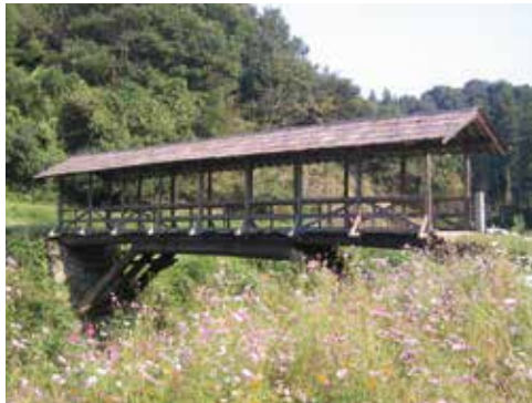
⑮ 지붕다리 타마루교

에히메현의 남부 지역에서는 목조 다리에 지붕을 달아 비로 인한 다리의 부패를 방지하여 오래도록 사용하였다. 예전에는 지역내에 10 개 이상이 있었지만, 홍수에 떠내려 가는 등으로, 지금은 몇 곳 밖에 남아 있지 않다. 지붕 다리는 생활로이며, 목탄 보관 등의 창고와 휴게소 등으로도 이용되었다.