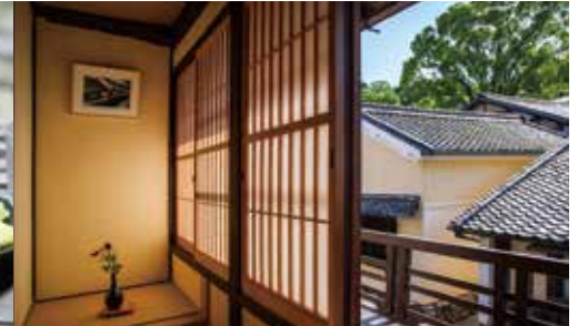
숙소 츠키노야 御宿 月乃家