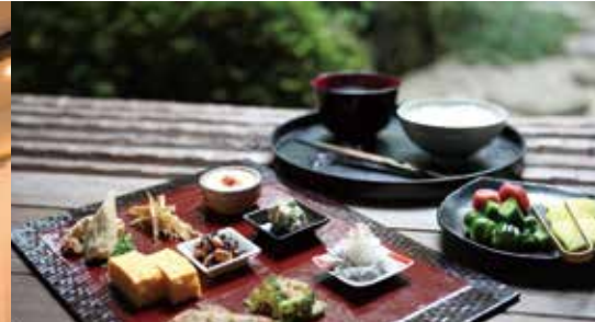
마치야별장 코코로 町家別荘こころ