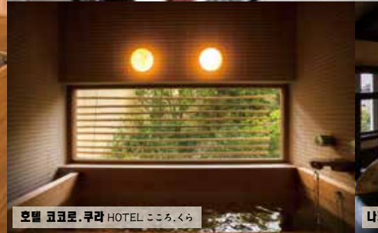
호텔 코코로.쿠라 HOTEL こころ.くら