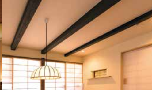
우치코노 아토 - HISA - 久