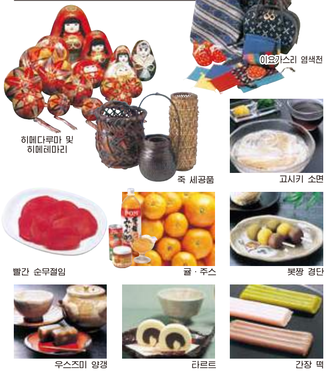
히메다루마 및 히메레마리