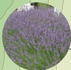
薰衣草 (6月上旬~7月下旬)