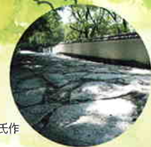
流れ坂 彫刻家・流政之氏作