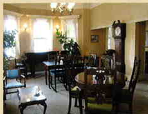
⑳ ティールーム 異人館