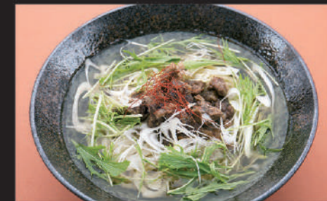
Udon · Beef · Welsh onion · Potherb mustard 乌冬面 · 牛筋 · 京葱 · 水菜 우동, 소림줄, 파, 야채

33 牛すじ煮込みうどん Gyusuji nikomi Udon 炖牛筋乌冬面 규스지니코미 우동 Hot 920yen