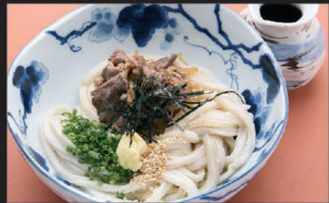
Udon · Beef · Ginger · Sesame · Welsh onion · Laver 乌冬面 · 肉 · 姜 · 芝麻 · 葱 · 海苔 우동, 고기, 생강, 참깨, 파, 김

4 肉ぶっかけ Nikubukkake 牛肉浓汁乌冬面 니쿠 붓카케 Hot Cold 820yen