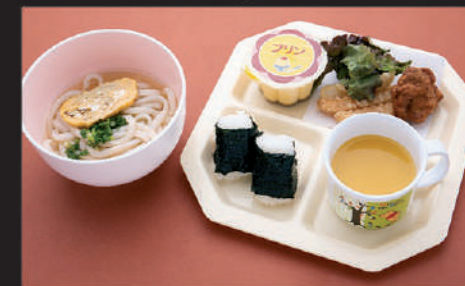
Kake Udon · Rice ball · Fried potato · Deep fried chicken · Juice · Pudding 清汤乌冬面 · 饭团 · 炸薯条 · 炸鸡块 · 果汁 · 布丁 주먹밥 · 감자튀김 · 닭고기 튀김 · 주스 · 푸딩

50 お子様膳 Okosamazen 儿童套餐 어린이 정식 Hot 700yen