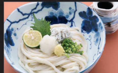
Udon · Ginger · Welsh onion · Grated radish · Whitebait simply scalded · Beafs teak plant · Sudachi 乌冬面 · 姜 · 葱 · 萝卜泥 · 盐水小鯧鱼 · 绿紫苏 · 酸橘 우동, 생강, 파, 무즙, 카마아게 멸치, 한잎, 초콜 (멸치: 삶은 작은 멸치를 얹은 우동)

13 しらすうどん Shirasu Udon 小鯧鱼乌冬面 시라스 우동 Hot Cold 660yen