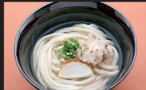
Udon · Welsh onion · Fish paste · Dried bonito 乌冬面 · 葱 · 鱼糕 · 鲣鱼屑 · 葱 우동, 파, 어묵, 가츠오부시

9 かけうどん Kake Udon 清汤乌冬面 카케 우동 Hot 510yen