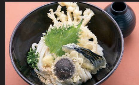
Udon · Vegetable tempura · Ginger · Welsh onion · Sesame · Beafs teak plant 乌冬面 · 蔬菜天妇罗 · 姜 · 葱 · 芝麻 · 绿紫苏 우동, 야채튀김, 생강, 파, 참깨, 한잎

17 野菜天ぶっかけ Yasaiten bukkake Udon 蔬菜天妇罗浓汁乌冬面 야사이텐 붓카케 Hot Cold 800yen