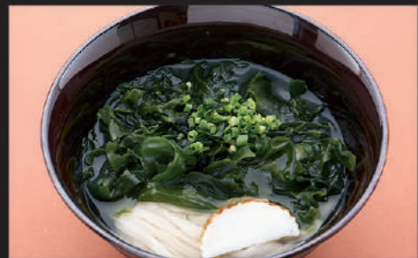
Udon · Seaweed · Welsh onion · Fish paste 乌冬面 · 裙带菜 · 水煮鱼糊 · 葱 우동, 미역, 파, 어묵

8 わかめうどん Wakame Udon 裙带菜乌冬面 와카메 우동 Hot 630yen