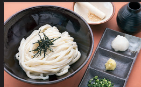
Udon · Laver · Ginger · Welsh onion · Grated radish · Sesame 乌冬面 · 海苔 · 姜 · 葱 · 萝卜泥 · 芝麻 우동, 김, 생강, 파, 무즙, 참깨

12 ぶっかけうどん Bukkake Udon 浓汁乌冬面 붓카케 우동 Hot Cold 560yen