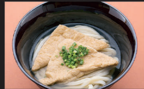
Udon · Deep fried tofu · Welsh onion 乌冬面 · 油炸豆腐 · 葱 우동, 유부, 파

7 きつねうどん Kitsune Udon 油豆腐乌冬面 키프네 우동 Hot 660yen