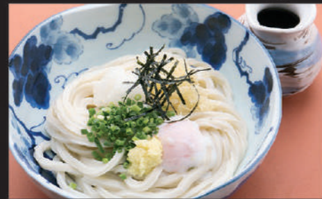
Udon · Hot spring egg · Grated radish · Ginger · Sesame · Welsh onion · Laver 乌冬面 · 温泉蛋 · 萝卜泥 · 姜 · 芝麻 · 葱 · 海苔 우동, 온천 달걀, 무즙, 생강, 참깨, 파, 김

6 温玉ぶっかけ Ontama bukkake 温泉蛋浓汁乌冬面 온타마 붓카케 Hot Cold 660yen