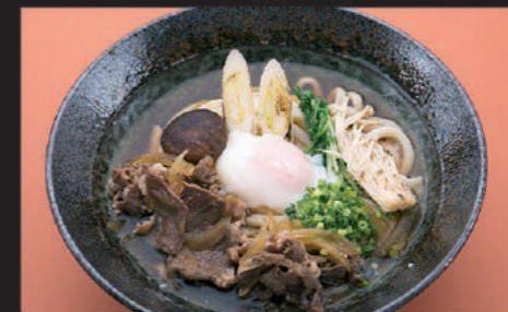
Udon · Beef · Shiitake mushrooms · Welsh onion · Enokitake mushrooms · Edible chrysanthemum · Hot spring egg 乌冬面 · 牛肉 · 香菇 · 京葱 · 茼蒿菜 · 金针菇 · 温泉蛋 우동, 소고기, 표고버섯, 파, 속갓, 온천 달걀

34 すき焼きうどん Sukiyaki Udon 寿喜烧乌冬面 스키야키 우동 Hot 1,220yen