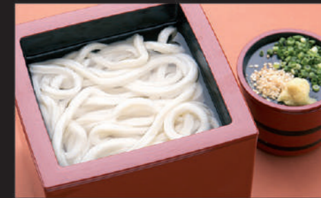
Kama-age Udon · Welsh onion · Sesame · Ginger 锅捞乌冬面 · 葱 · 芝麻 · 姜 카마아게 우동, 파, 참깨, 생강

16 釜揚げうどん Kama-age Udon 锅捞乌冬面 카마아게 우동 Hot 580yen