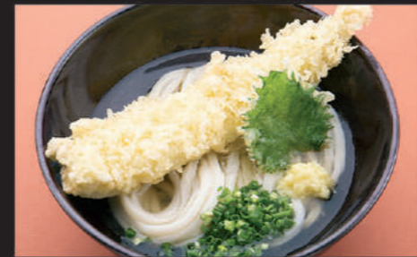
Udon · Conger eel tempura · Beafs teak plant · Ginger · Welsh onion 乌冬面 · 星鰻天妇罗 · 绿紫苏 · 姜 · 葱 우동, 아나고 한마리 튀김, 한잎, 생강, 파

14 穴子一本揚げ天婦羅うどん Anago ipponage Udon 星鰻整条炸天妇罗乌冬面 아나고 잇폰아게 텐푸라 우동 Hot 800yen