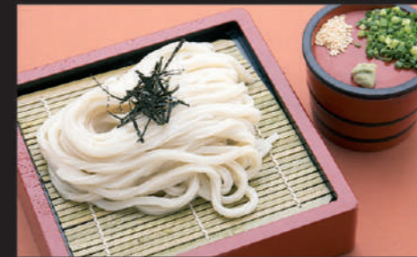
Udon · Welsh onion · Sesame · Laver · Wasabi 乌冬面 · 葱 · 芝麻 · 海苔鱼 · 芥末 우동, 파, 참깨, 김, 고추냉이

15 ざるうどん Zaru Udon 竹扨乌冬面 자루 우동 Cold 580yen