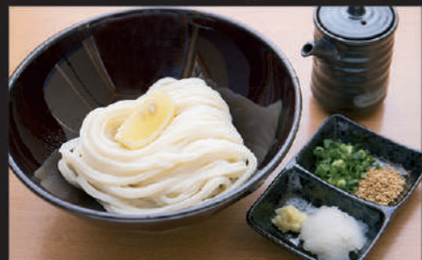
Udon · Lemon · Grated radish · Ginger · Welsh onion · Sesame · Soy sauce 乌冬面 · 柠檬 · 萝卜泥 · 姜 · 葱 · 芝麻 · 酱油 우동, 레몬, 무즙, 생강, 파, 참깨, 간장

11 生醤油うどん Kishouyu Udon 原味酱油乌冬面 키조유 우동 Cold 560yen