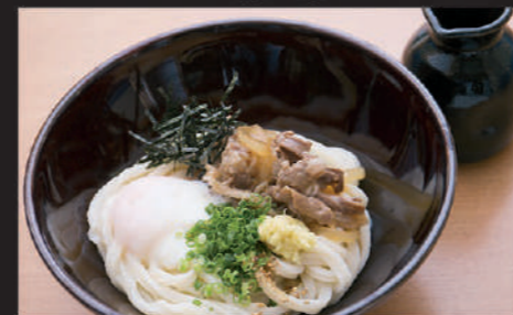
Udon · Beef · Laver · Welsh onion · Ginger · Hot spring egg 乌冬面 · 牛肉 · 海苔 · 葱 · 姜温泉蛋 우동, 고기, 김, 파, 생강, 온천 달걀

35 温玉肉ぶっかけ Ontama niku bukkake Udon 温泉蛋牛肉浓汁乌冬面 온타마니쿠 붓카케 Hot Cold 940yen