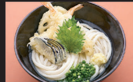
Udon · Tempura · Ginger · Welsh onion · Beafs teak plant 乌冬面 · 天妇罗 · 姜 · 葱 · 绿紫苏 우동, 튀김, 생강, 파, 참깨, 한잎

18 天婦羅うどん Tempura Udon 天妇罗乌冬面 텐푸라 우동 Hot 890yen