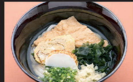
Udon · Seaweed · Welsh onion · Deep fried tofu · Fish paste · Dried bonito · Rolled egg 乌冬面 · 裙带菜 · 葱 · 油炸豆腐 · 鱼糕 · 鲣鱼屑 · 鲜味鸡蛋卷 우동, 미역, 파, 유부, 어묵, 가츠오부시, 일본풍 계란말이

10 かやくうどん Kayaku Udon 带菜码乌冬面 카야쿠 우동 Hot 610yen