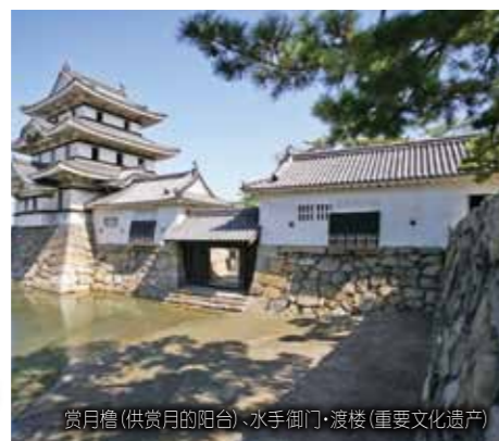
赏月台 (供赏月的阳台)·水手御门·渡楼 (重要文化遗产)