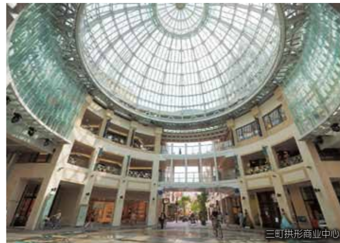
三町拱形商业中心