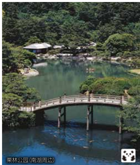
栗林公园 (南湖周边)