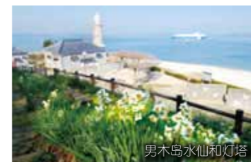
男木岛水仙和灯塔

从高松港坐船约20分钟左右可到达女木岛。在鹭峰瞭望台,可360度观赏流传鬼传说的鬼岛大洞窟和濑户内海。有诸多此类景观。