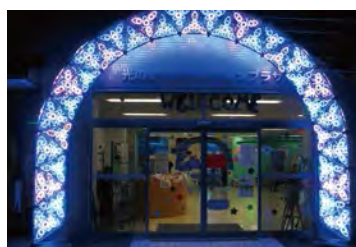
最前沿LED匯聚光之城車站廣場