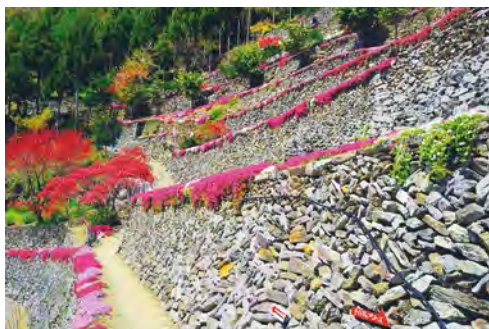
在陡峭的山坡斜面完美堆積的美鄉石堆還被選入“日本故鄉100選”。這一歷史可追溯到江戶時代。