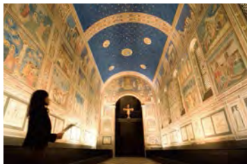
依照當地實景將空間再現的史格羅維尼禮拜堂