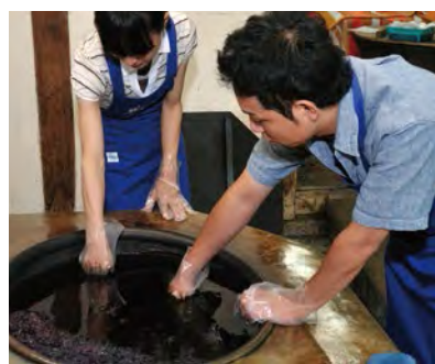
向藍染師學習紮染技藝。

每次進行藍染時，顏色都是逐漸加深的。“淡藍色”“綠色”有“留紺”等48種被命名的顏色。