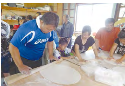
在因鹽田而繁榮的鳴門的一個地區，鳴門烏龍麵作為勞動工作者的零食大受歡迎。鳴門市內各處都能吃到鳴門烏龍麵。