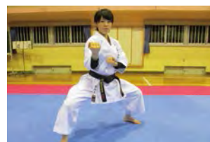
由於可以運動到日常生活中較少活動的肌肉，因此可以體驗理想的全身運動。

基本的技巧、形式、約定交臂（自由式角力），即使是女性或本身體力不佳的人也能安全體驗空手道。空手道教育作為拓寬豐富人性的人類教育的一環，受到廣泛支持。