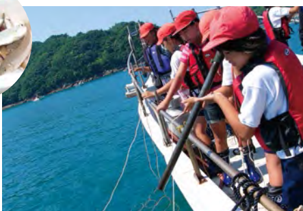
向海面投棒的作業緊張刺激。

在拉上來的網中,可以捕獲從大到小、各式各樣的魚種。透過撒網捕魚,向海上的男子漢們學習捕魚的艱辛和樂趣。