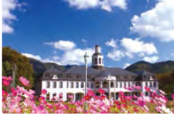
在鳴門市德國館舉辦各式各樣的音樂會。