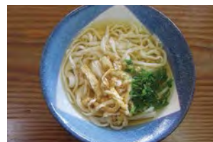
鳴門地區大受歡迎的靈魂食物“鳴門烏龍麵”。家庭手打，最具飽足感。

大家一起來手打出令人懷念、獨一無二的美味“鳴門烏龍麵”。手打出來後馬上便能細細品味堪稱鳴門風味的獨特烏龍麵。