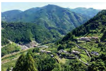
依然保存日本原始風貌的空之鄉