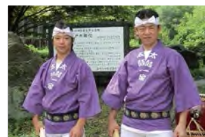
以“祭典之音”為中心，還為神社等擔任祭神演奏的“太鼓一家”。

從擊鼓的身體姿勢開始，學習擊鼓方法、當地擊鼓旋律等，傾注靈魂擊打和太鼓，可以體驗日本那亙古的愉悅心情。