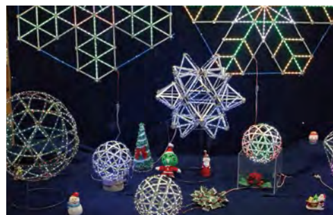
使用了絢爛奪目的LED燈光的原創藝術作品 增進之間的感性認知,一同體驗作品創造的喜悅。