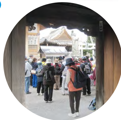
在同步行的道路中,加深團隊的友誼。