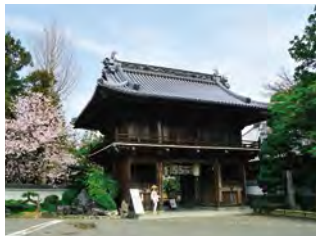
88所以及1460km發願之寺 “靈山寺”