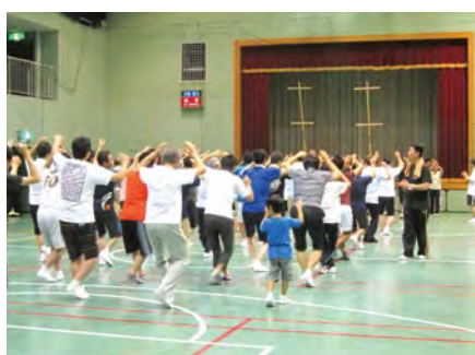
讓我們跟隨歡騰的伴奏,來一起學習阿波舞。