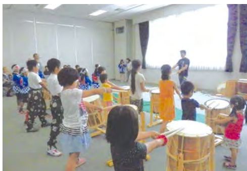
心無雜念地擊鼓，可以實際體驗表演的快樂和自我釋放的喜悅！