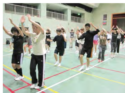
本連成員到齊後,開始演講。