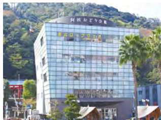
位於眉山山麓的阿波舞會館。

日本三大祭典之一“阿波舞”。 大家一起成為“癡狂舞者” 擺動身體,釋放聲音,讓彼此的心融為一體!