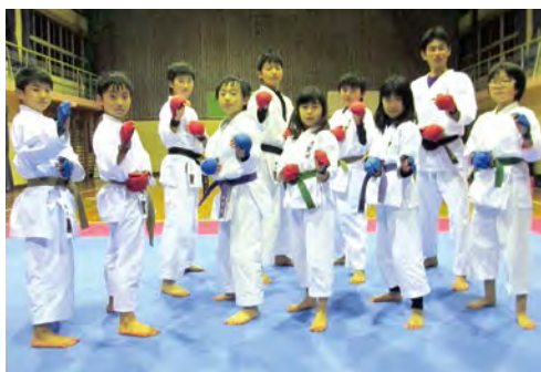
掌握空手道技能的同時，還掌握了禮節、勇氣、耐力、內省、克己、利人、協調性、體貼等社會能力。