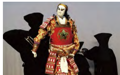
使眼睛嘴巴和五指活動起來，賦予人偶表情和生命