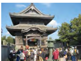
在大師開創的修行之道中與同伴們一齊潛心巡禮,尋找堅韌的勇氣和堅持過後的精彩。