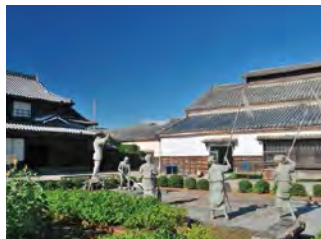
保留藍商舊宅至今的藍館。

使用阿波藍的技師所創造出的的藍染。 大家一起染出的是 “JAPAN BLUE”的掛毯。