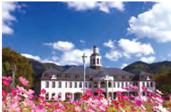
鸣门市德国馆举办各式各样的音乐会。