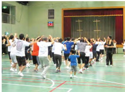
让我们跟随欢闹的伴奏，掌握阿波舞。