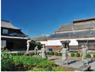
保留蓝商旧宅至今的蓝馆。