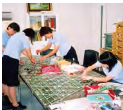
在LED的先进地域，学习LED原理和技术的宝贵体验。