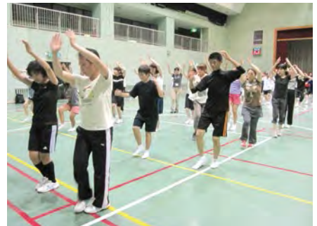
本连成员到齐后，开始演讲。