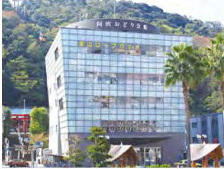
位于眉山山麓的阿波舞会馆。

日本三大祭典之一“阿波舞”。 大家一起成为“癫狂舞者” 摆动身体，放出声音，让心融为一体！