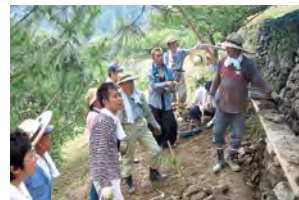
用传统的技法体验垒石。石堆保护河流水质，且与萤火虫栖息环境的保护息息相关。

[体验内容]体验支撑山间生活的“垒石”智慧和技術，学习其对环境的作用等。与同伴一起努力垒石，体会与自然共存的快乐和重要性。