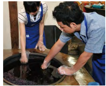
向蓝染师学习扎染技艺。

每次蓝染时颜色都是渐渐加深的。“淡蓝色”“缥色”有“留紺”等48种被人命名的颜色。