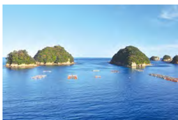
具有美丽里亚斯式海岸的水床湾。