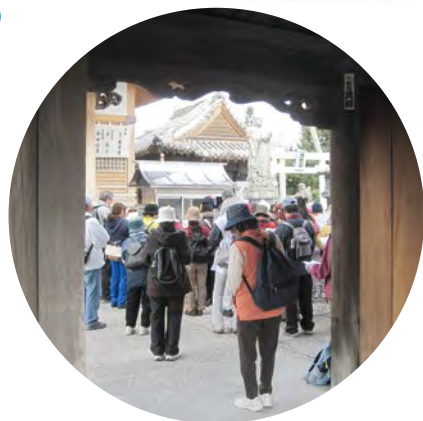
在同一步行的道路中， 加深团队的友谊。