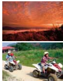
バギーも楽しめる