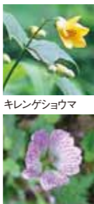
キレンゲシヨウマ シコクフウロ