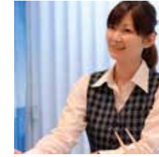
スタッフが心を込めた笑顔で対応します。

1)落ち着いた内装の和室は、外国人旅行者に人気。2)大自然に面した客室からは、小歩危峡が一望できます。3)「鉄道ルーム」と呼ばれる和室は、鉄道ファン垂涎の撮影ポイント。4)対岸の山々が迫る、大歩危小歩危峡を見下ろす絶景露天風呂。