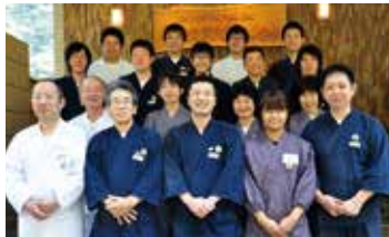
スタッフが心を合わせて笑顔のおもてなし。