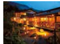
1)天井の高い開放感あふれる洋室。2)四季折々、自然の移ろいを感じながら浸れる開放的な露天風呂。