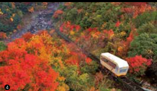
1) ケブルカーを下った先にある、源泉かけ流しの露天風呂。2) 山並みを眺めながら窓辺でひと休み 3) お美姫鍋会席。阿波パークと地酒を使った特製ダンが自慢。4) 秋は紅葉の絨毯をケーブルカーが縫うように進みます。