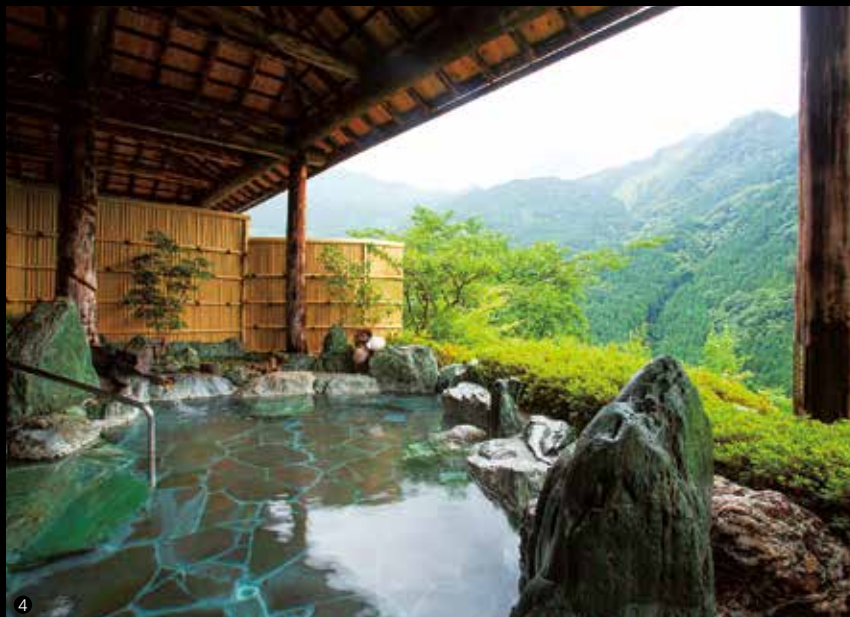
1) 展望風呂付の特別室。2) 趣のある囲炉裏端で、山里の味覚が味わえます。3) 天空の露天風呂へは山小屋風の専用ケーブルカーで。4) 満天の星を仰ぎ、雲海を見下ろす、ホテル自慢の「天空露天風呂」。