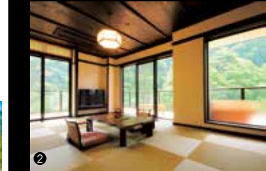
1)そば粉の香りが甘みや粘りを感じることができる。こだわりの手打ち蕎麦。2)落ち着いた雰囲気のある和室。すべての客室には、かけ流しの露天風呂が備えられています。3)V字型に切り込まれた祖谷渓谷は、足がすくむほどの高さ。