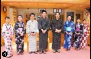
1)阿波の青石を敷き詰めた大浴場からは、祖谷渓谷が望めます。2)開放感のあるレストラン。3)廊下と客室の段差がないバリアフリーの和室です。4)最高の思い出となるようスタッフが全力でサポート。5)阿波の青石をふんだんに使った、野趣あふれる露天風呂。