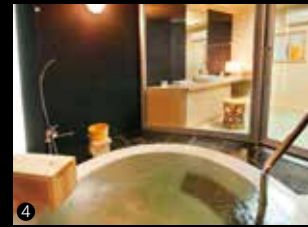
1)大歩危峡を見下ろすテラス風の露天風呂は、川風が肌に当たって心地よい。2)手足を伸ばして寛げる、畳とベッドを備えたモダンな和洋室。3)風炉裏で語りあう憩いの時間。4)外壁に炭を使った貸切風呂は、マイナスイオン効果で心身ともにリラックスできます。