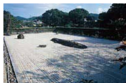
■ 無染庭 无染庭园