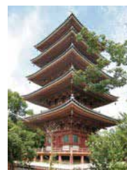
■ 五重塔 五重塔