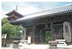
■ 仁王門 仁王门