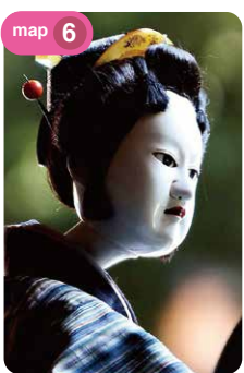
木偶淨琉璃戲的木偶