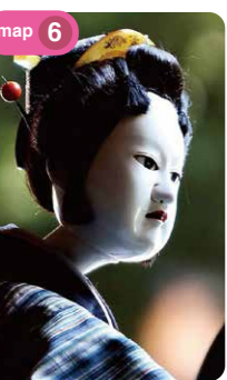
木偶净琉璃戏的木偶